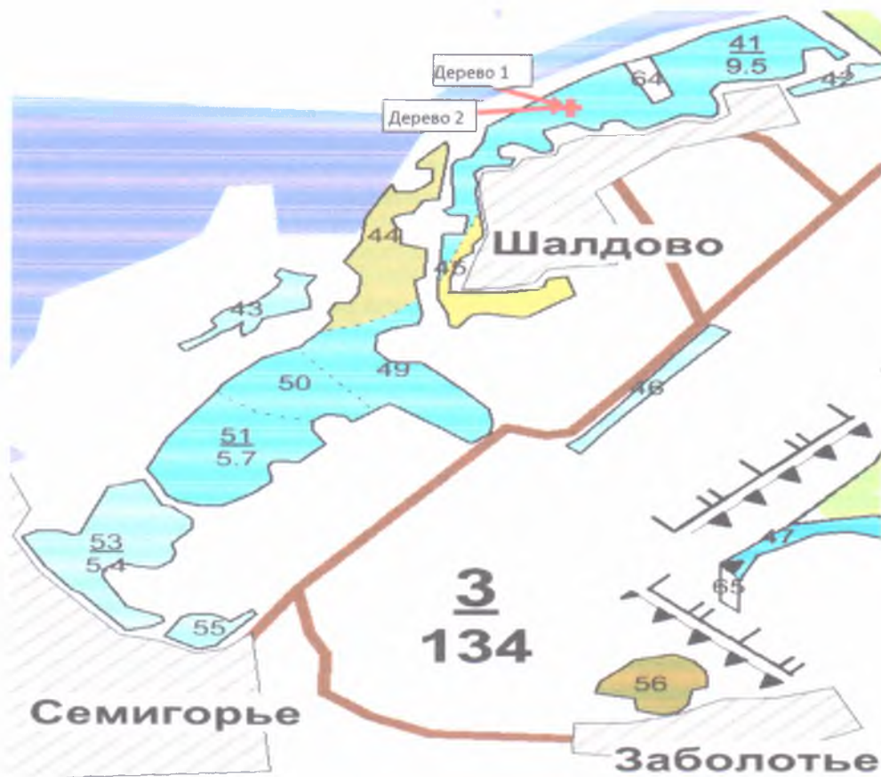
Пространственное размещение лесопатологических выделов

(включается в Акт при выделении лесопатологических выделов, для указания пространственного расположения поврежденных и погибших насаждений)